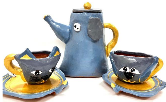
Рис.4. Декоративный чайный сервиз обучающейся «В мире животных»