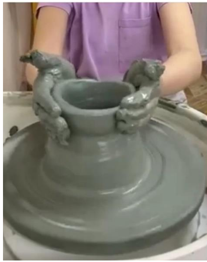
Рис.1. Создание вазы на гончарном круге

Одним из ярких примеров народных промыслов является создание глиняных игрушек. В России существует несколько известных центров производства таких игрушек: дымковская, филимоновская и каргопольская.