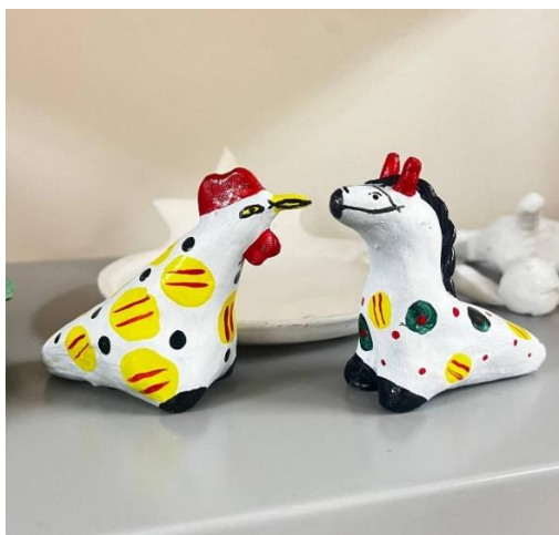
Рис.2. Народные игрушки обучающихся

Чтобы процесс обучения для ребят был еще более интересным, был создан образовательный ресурс «Народные промыслы: дымковская игрушка», где обучающиеся с помощью компьютерных технологий знакомятся не только с историей происхождения глины, но и созданием дымковской игрушки. Данный ресурс способствует развитию творческих способностей, помогает в воспитании уважения к культурному наследию нашей страны (рис.3).