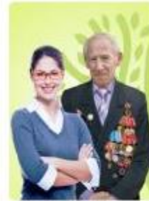
Без профильного образования возраст старше 18 лет