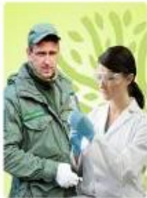
Эксперт, студент, специалист, руководитель в экологической сфере