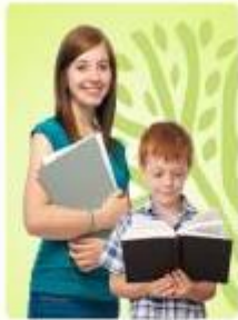
Подростки 12-17 лет