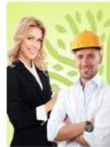
Сотрудник организации-партнера Экодиктанта

Категории отличаются по сложности вопросов: от низкой (для подростков 12-17 лет) до высокой (для экспертов, студентов, специалистов, руководителей в экологической сфере).